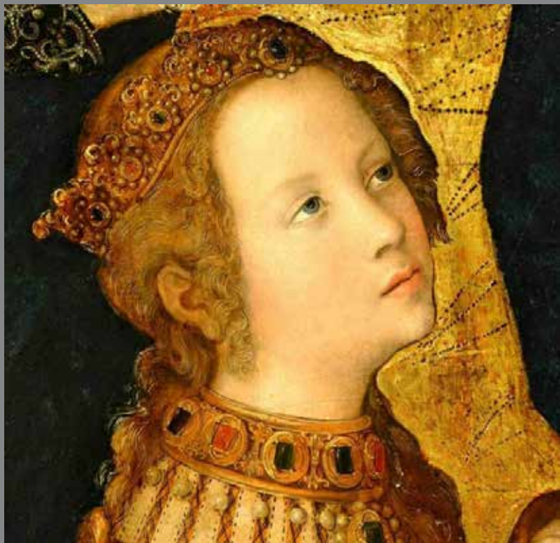
Pražský oltář - detail (Sv. Kateřina)