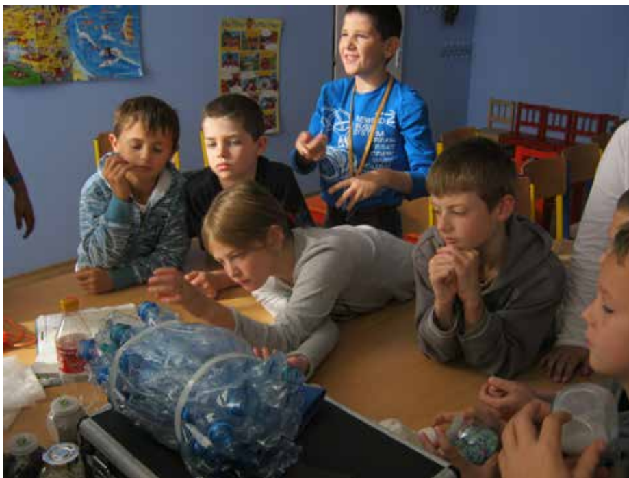
Škola učí děti poznávat svět...