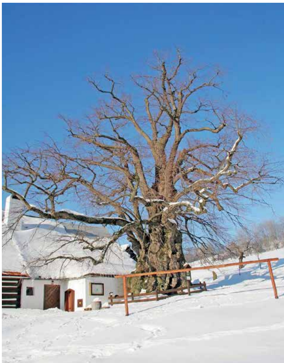
Lukasova lípa v Telecím.