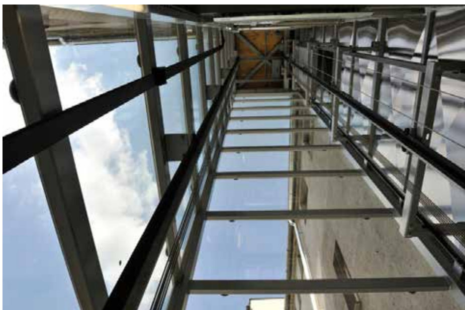
Pohled do šachty výtahu.