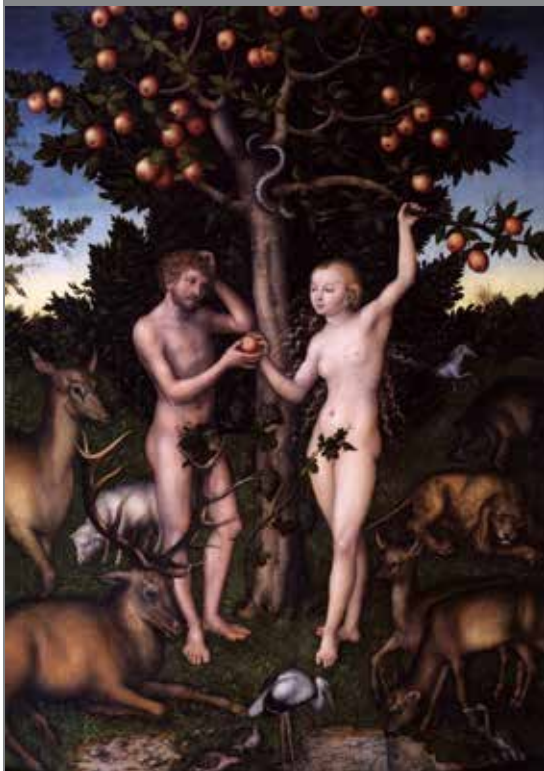
Adam a Eva