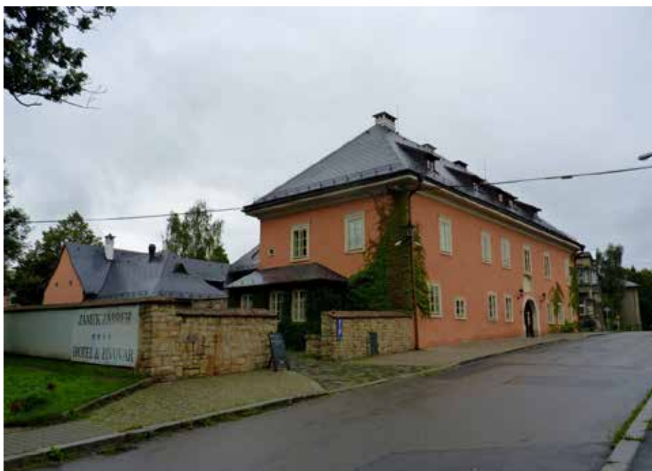
Zábřežský zámek dnes.

Další z incidentů se odehrál o Vánocích, kdy do zámku přišlo na koledu pět mladých dívek, „...a když vánoční písně zpívati počaly [...], tu ihned pan Mikuláš Orlík dveře zavřítí dal a tuze,