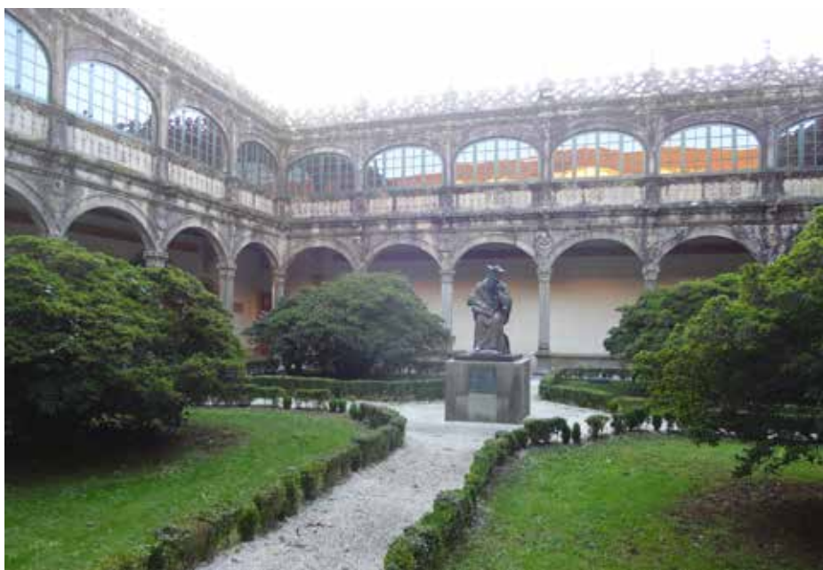
Budova rektorátu a univerzitní knihovna - Pazo de Fonseca.