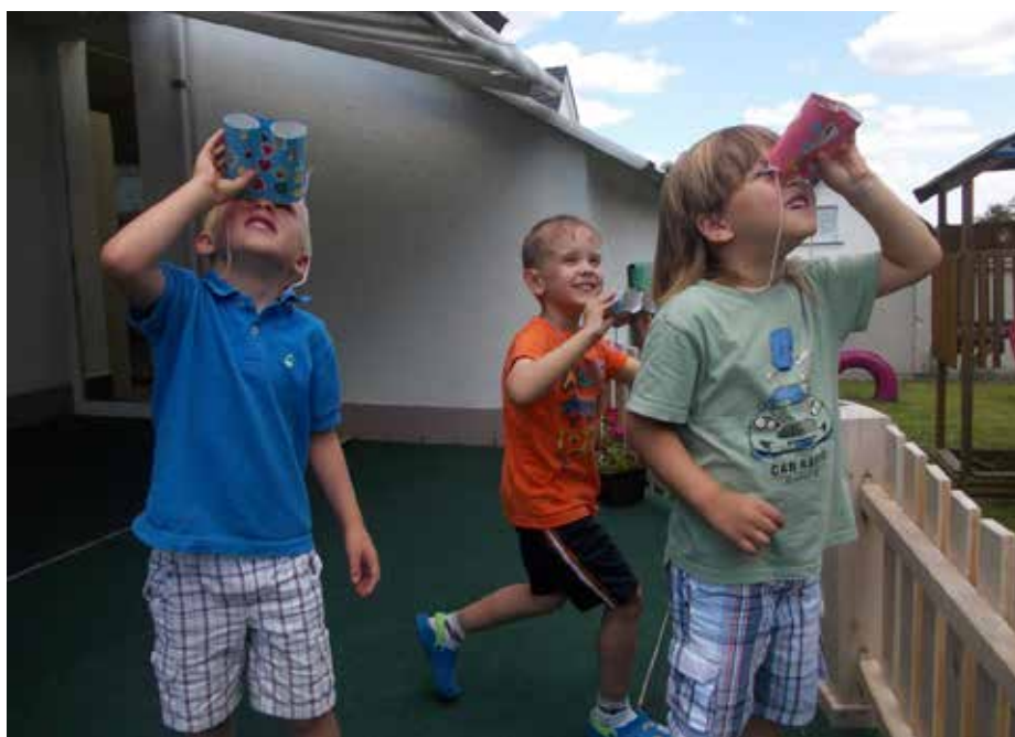
... a experimentovat

Dlouhodobě je naše školství umanuté a uvízle v podivně bezprizorním, konzervativním časoprostoru. Na jednu stranu jsou školy hojně dotovány evropskými penězi, nakupuje se drahé vybavení, nábytek, zatepluje se ostosest, učitelé jsou neustále školeni v nových přístupech a metodách, což samozřejmě opět platí EU, a na druhou stranu nikoho nezajímá, jaká je kvalita výuky, jak se pracuje s dětmi, které jsou mimořádné na obou pólech,