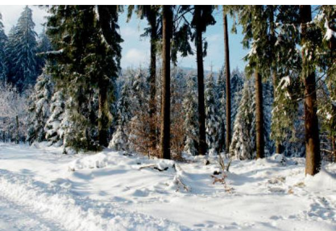
BESKYDY 2012.